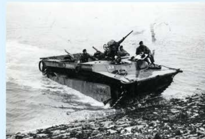
De landing bij Baarland - oktober 1944.