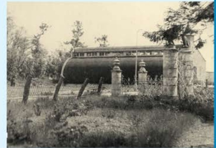
De noodkerk (1946)

De kerk werd opgetrokken uit twee nissenhutten, die door de Canadezen achtergelaten zijn na de oorlog. Deze is nu te zien in het Bevrijdingspark bij het Bevrijdingsmuseum Zeeland te Nieuwdorp.