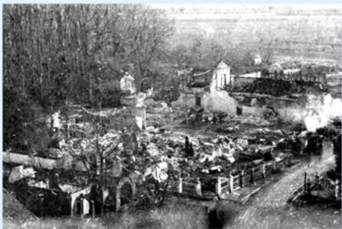
Oktober 1944; 'Versailles aan de Schelde' verwoest

Tijdens de oorlog heeft het buitenverblijf gediend als onderkomen voor bejaarden uit Vlissingen, omdat het voor hen daar te gevaarlijk was. Aan het einde moesten ze weer vertrekken vanwege de evacuatie.