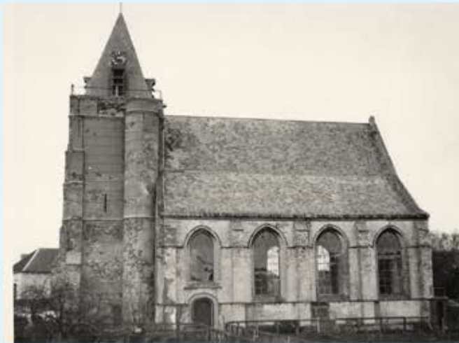
De 15 e eeuwse kerk met zijn oudere toren (ca. 1380)

De kerk was het voornaamste doelwit van de geallieerden. De toren werd immers als uitkijkpost gebruikt door de Duitsers.