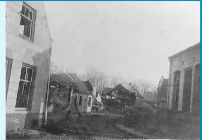
Verwoesting van de huizen in de Van Hattumstraat

Veel huizen in de buurt van de kerk werden getroffen door de bombardementen van oktober 1944, onder meer de huidige Van Hattumstraat, de herberg (links) en de school (rechts).